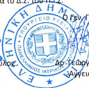
Δρ Γεώργιος Ι. Ελευθερίου Αγγειοχειρουργός