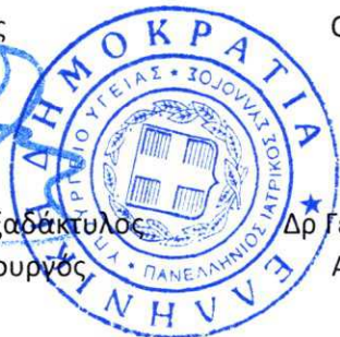
Δρ Γεώργιος Ι. Ελευθερίου Αγγειοχειρουργός